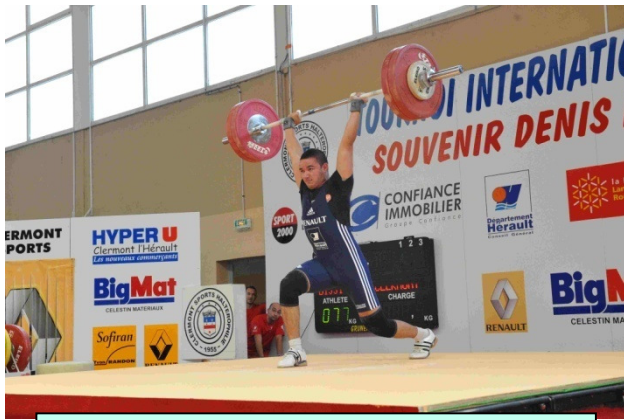
Sami Bijji juniors 77 kg