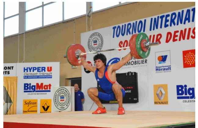
Redon Manushi seniors 94 kg