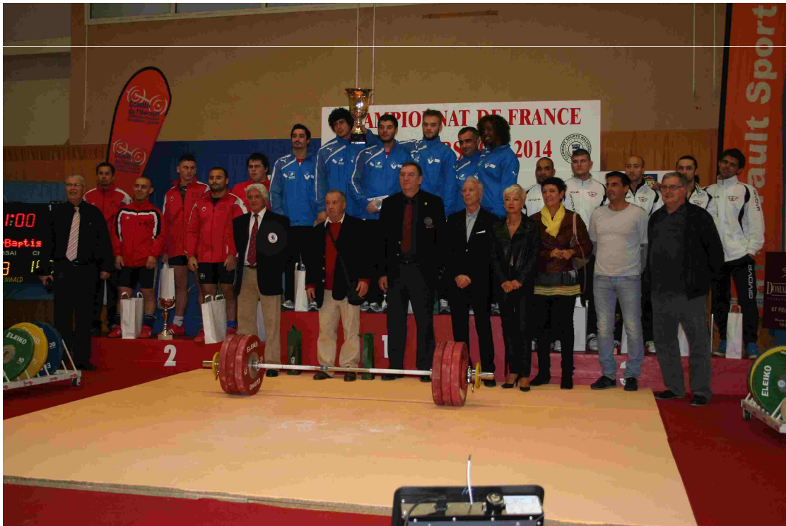
Le podium de la 1ère journée: 1er Clermont Sports 597,2 - 2ème EEAR Montoux 477,2 – 3ème CM Orléans 472 Sur la photo les équipes sont en compagnie des élus, sponsors, arbitres et dirigeants