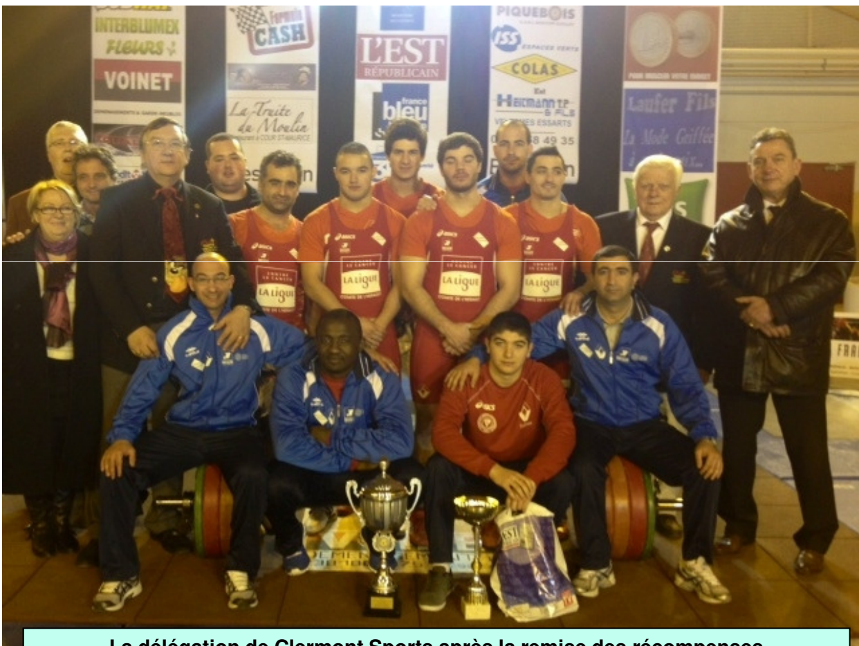
La délégation de Clermont Sports après la remise des récompenses A la Finale du Championnat de France des clubs Samedi 2 mars 2013 à Besançon