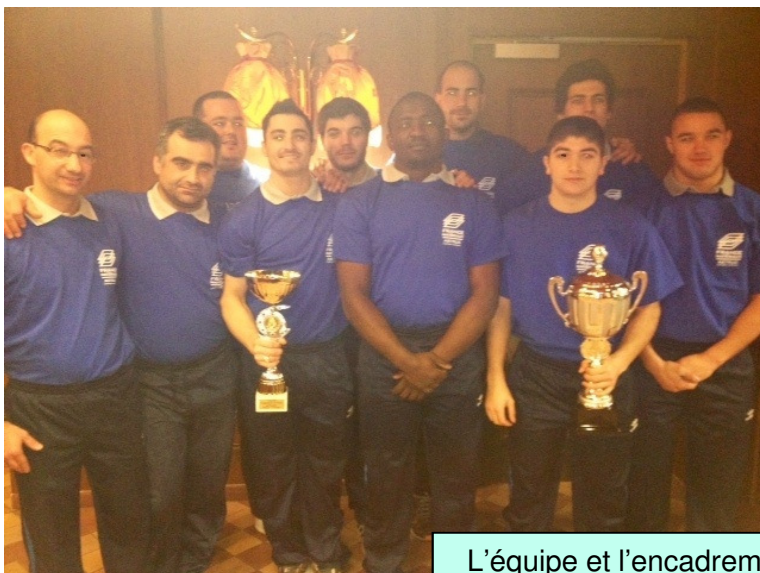
L'équipe et l'encadrement de Clermont Sports Samedi 2 mars 2013 à Besançon